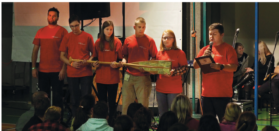
Na Slovensku je temno.