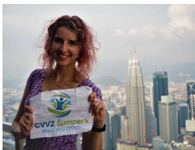
Kuala Lumpur, Malajsie.