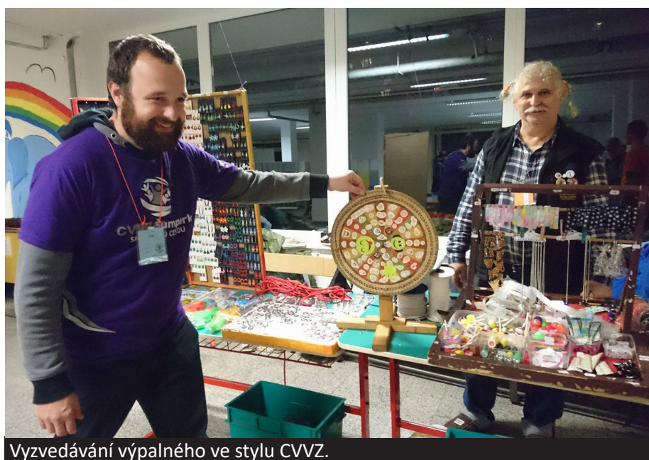
Vyzvedávání výpalného ve stylu CVVZ.