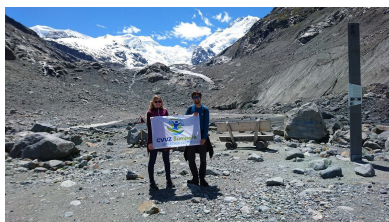
Morteratsch Gletscher, Švýcarsko.