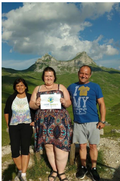
Durmitor, Černá hora.