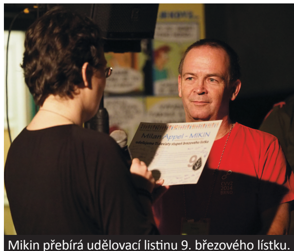
Mikin přebírá udělovací listinu 9. březového lístku.

Dlouho do noci se pak do potemělých šumperských zahrad a ulic linou tóny hudby z kytar, flétny, kláves a triangelů, jimiž Pouta oslavila průběh druhé šumperské CVVZ.